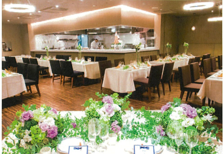
▲木の温もりあふれるアットホームな空間。オープンキッチンからは焼き立てのパンや料理のおいしそうな香り…ゲストの期待も高まる！