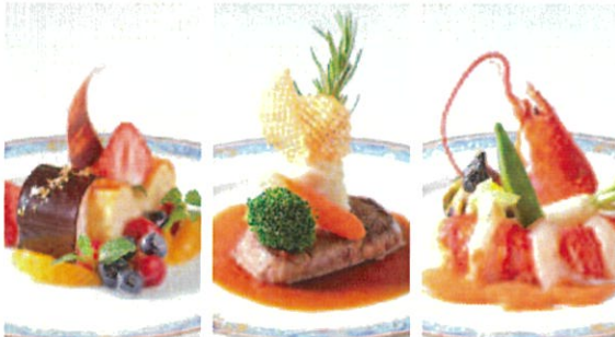
▲ロコミでも大好評の料理は、彩り華やかで味も秀逸！試食もできるから安心！