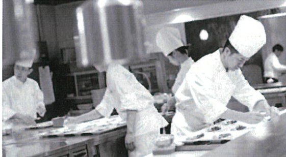
▲ふたりだけのオリジナルメニューやゲスト一人ひとりに合わせたアレンジも対応